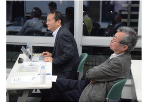
コーディネーターからのコメントの様子

JR山手線・京浜東北線田町駅より徒歩1分、都営三田線・浅草線三田駅より徒歩5分に立地する田町キャンパスで開催します。