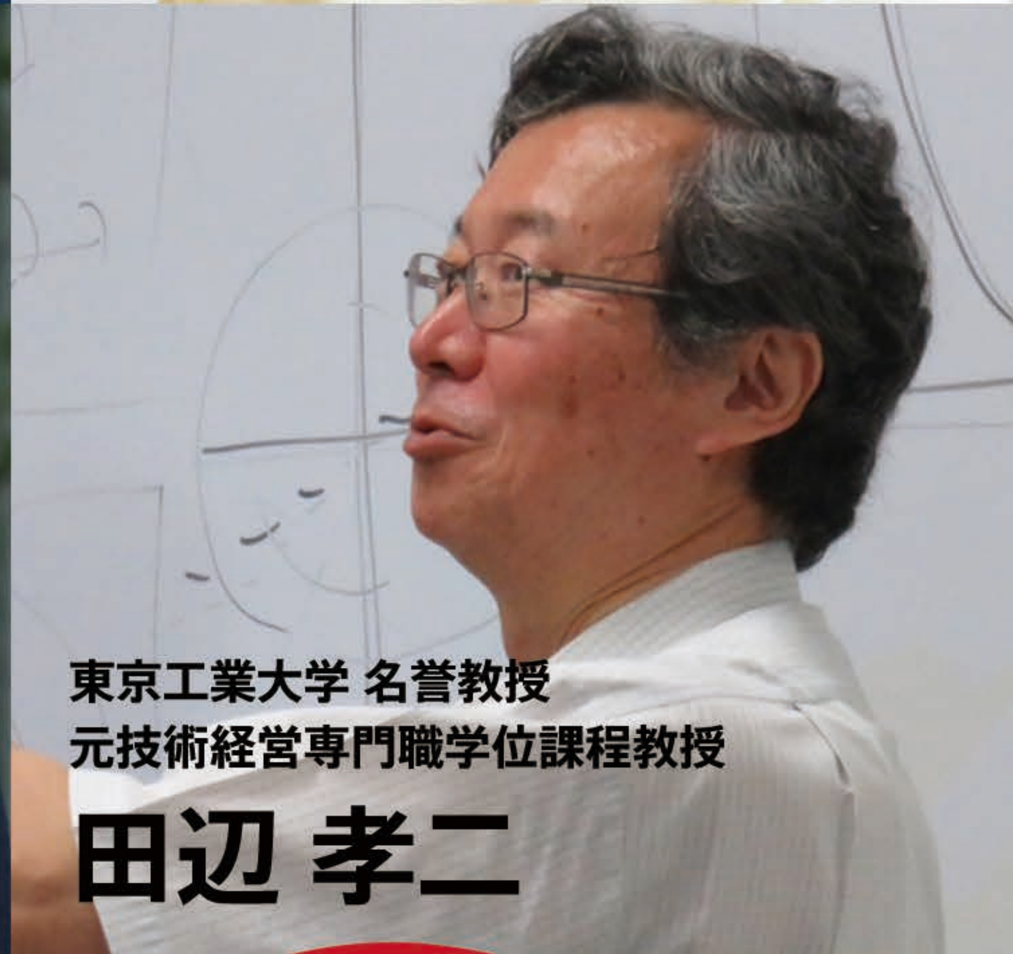
東京工業大学 名誉教授 元技術経営専門職学位課程教授