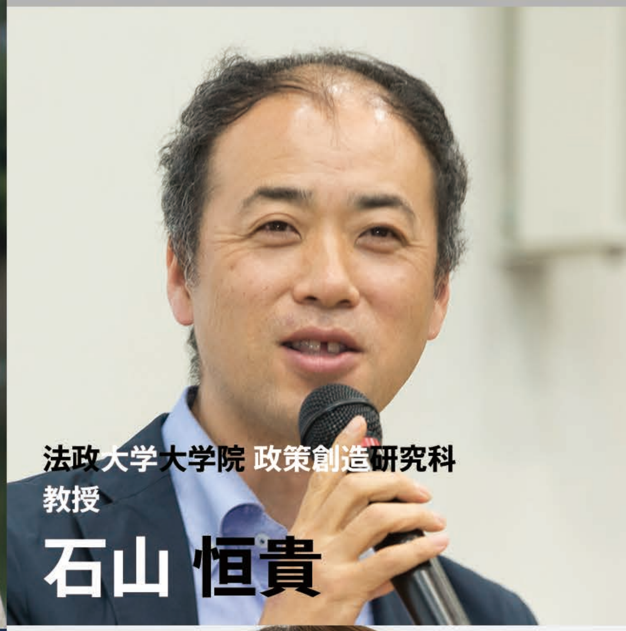
法政大学大学院 政策創造研究科 教授