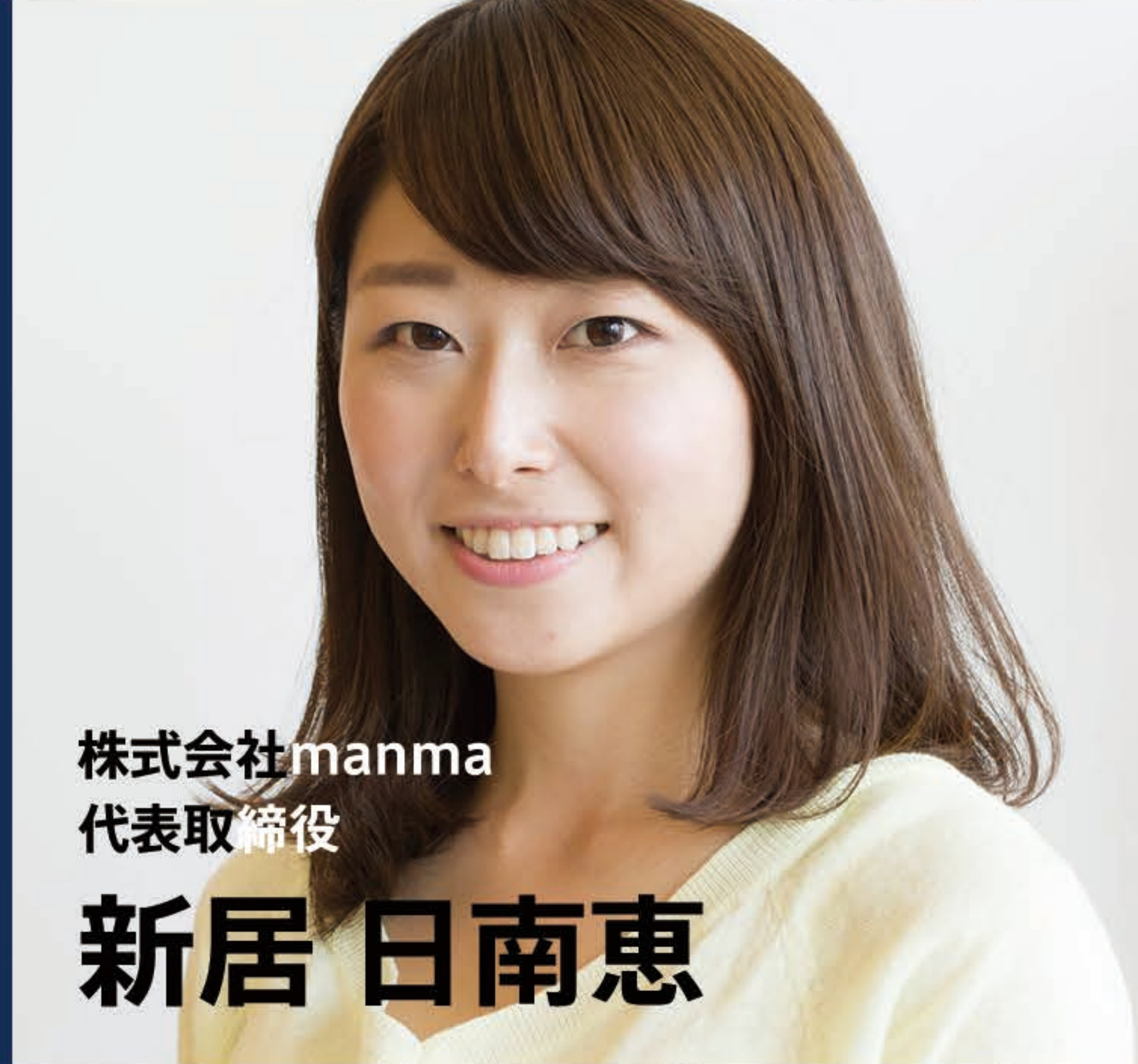
株式会社manma 代表取締役