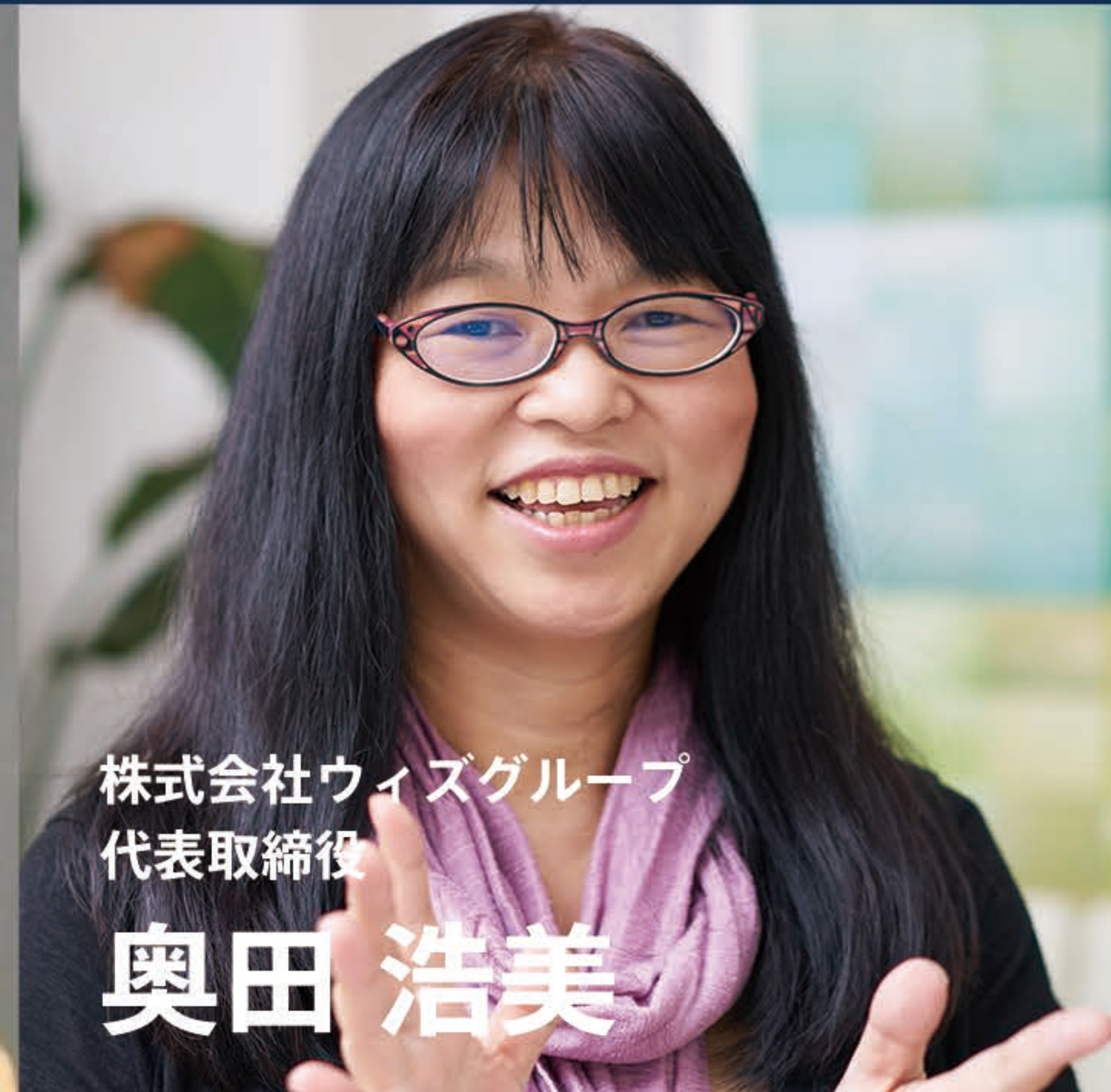
株式会社ウィズグループ 代表取締役