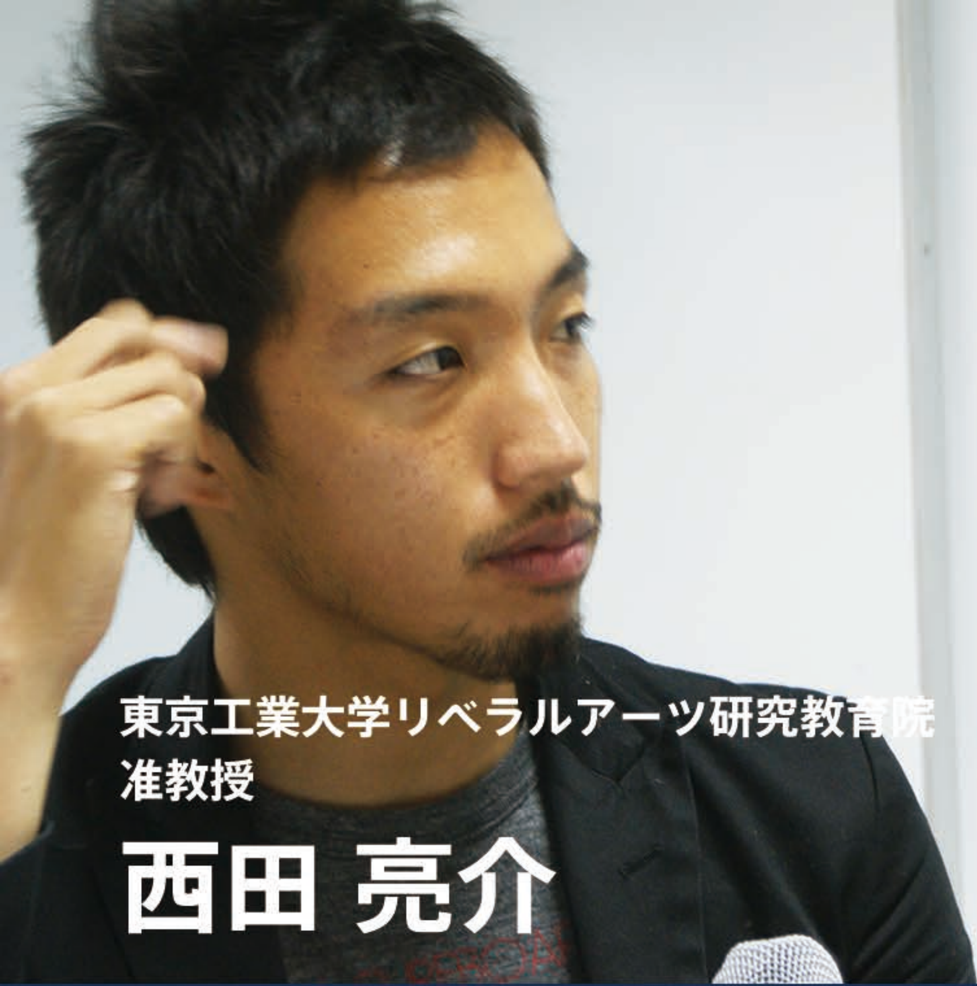
東京工業大学リベラルアーツ研究教育院 准教授