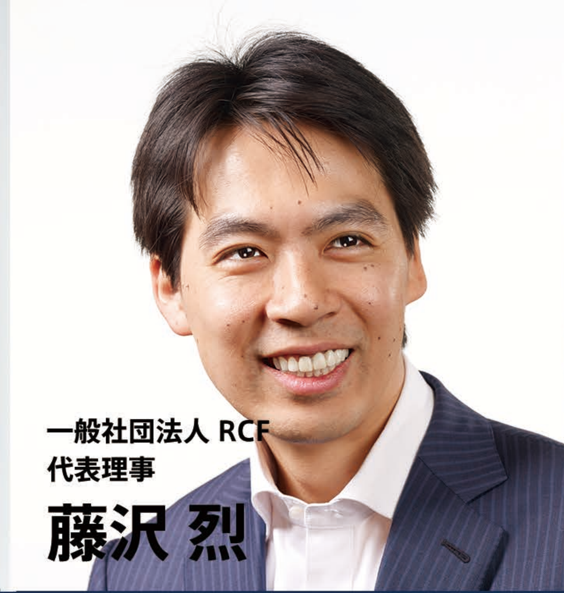
一般社団法人 RCF 代表理事