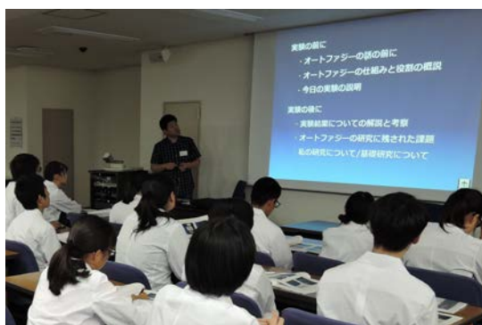
中戸川研スタート