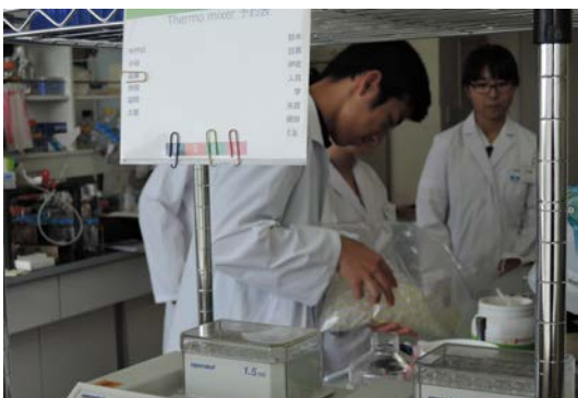
顕微鏡観察のためのプレパラートを 作製する高校生たち