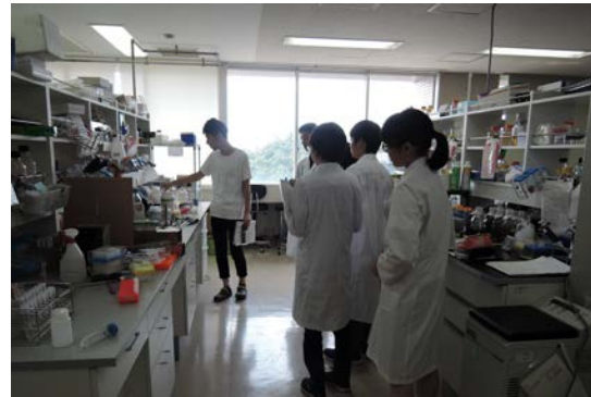
高校生たちに顕微鏡観察のための プレパラート作製を指導