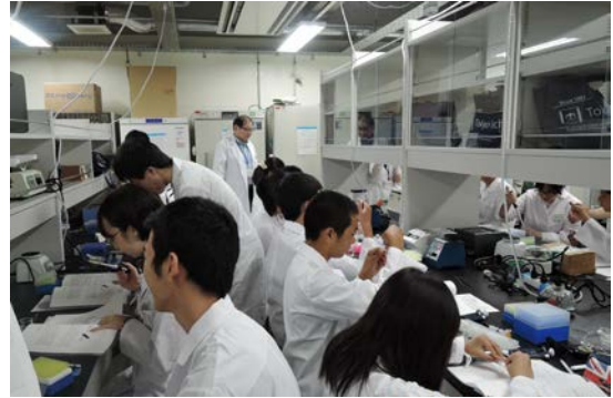
マイクロピペッター操作の練習をしました