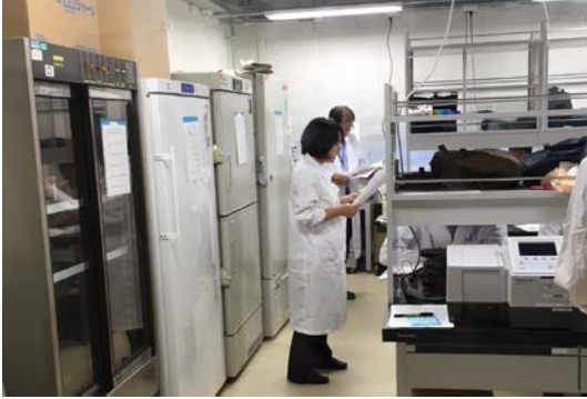
中村・八波研スタート 実験手順を説明しました