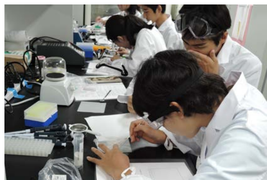
洗濯洗剤から酵素が含まれるカプセルを取り出しています。みんな真剣です。