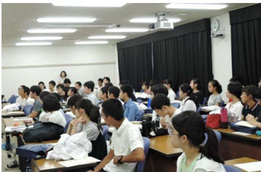
2日間よく頑張りました