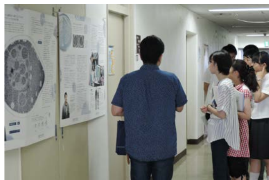
研究室を案内しました