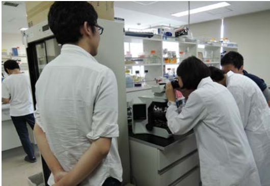
熱心にオートファジーを観察する高校生たち