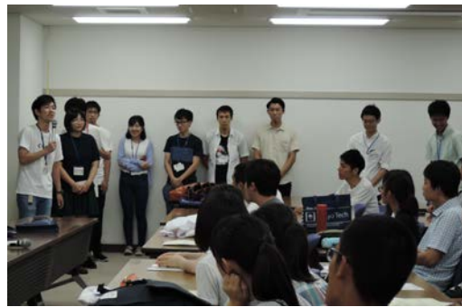
中村・八波研スタッフ