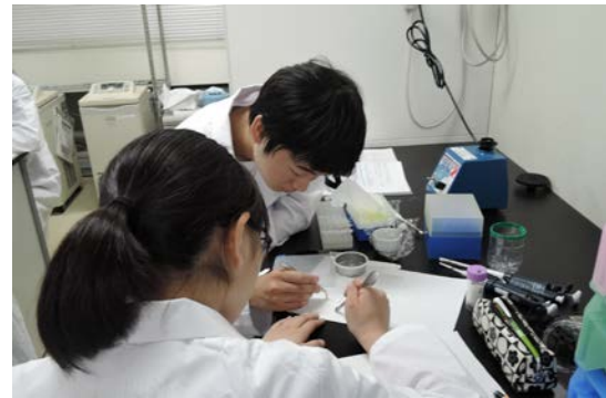
洗濯洗剤からアルカリ酵素が含まれるカプセルを取り出しました。 ピンセットなどを使って、一粒一粒丁寧に取り出しました。みんな集中していました。