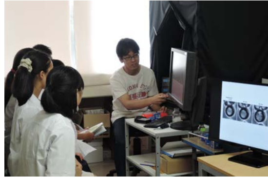
蛍光顕微鏡観察の実演