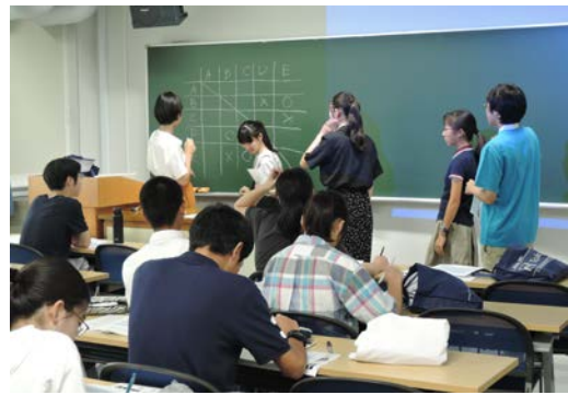
実験後の考察・発表・討論の様子です 自分達の実験結果をよく考えました