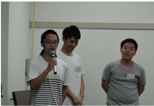
中戸川研スタッフ