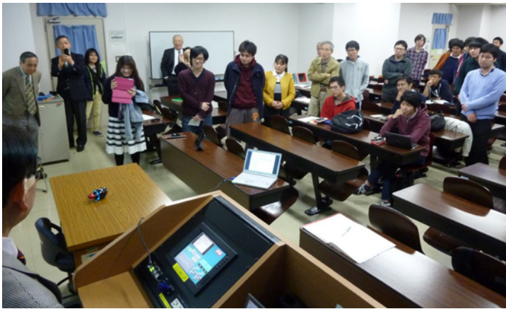
実演中の会場風景 (すずかけ台, B223 講義室) 左中央の机上にあるのがロボットウオークマン Rolly で、曲に合わせて光り、かつ踊りながら音楽を奏でる。人工知能搭載のペットロボット AIBO の流れを汲む。