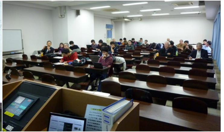
会場風景 (すずかけ台, B223 講義室)