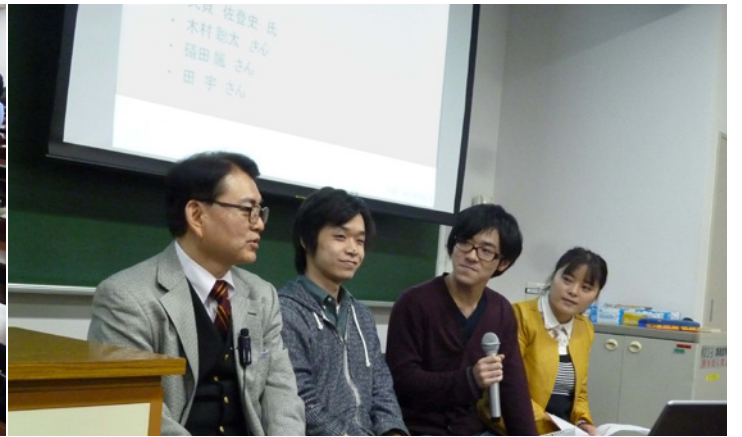
ゼミ後半のパネルディスカッション 「ビジネス人生で海外志向・起業志向は必要か？」