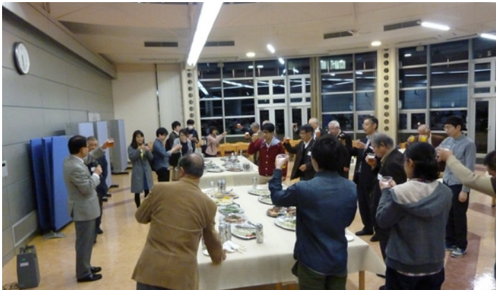
交流会での乾杯 (すずかけホール 3F ラウンジ)